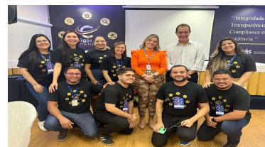
Time da Gerência de Governança, Riscos e Compliance - GEGRC