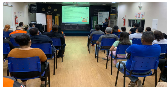
Time GEGRC realizou treinamento sobre as Políticas de Governança Corporativa e Conflito de Interesses em Agosto.