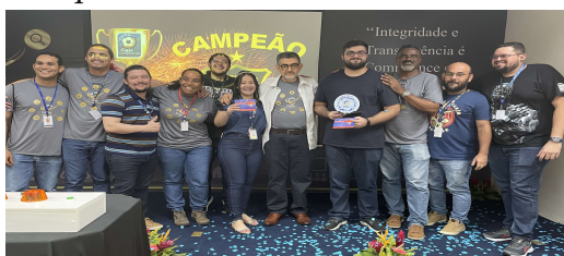
O time da GETIN foi o grande Campeão da Copa Cigás em Compliance

Em disputa emocionante contra a Gerência Jurídica – GEJUR, a Gerência de Tecnologia da Informação - GETIN venceu a primeira edição da Copa Cigás em Compliance!