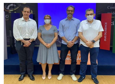
A Diretoria Executiva da Cigás também esteve presente.

Esse evento que foi fruto da parceria Cigás-CGE, é um dos previstos no calendário do Programa Cigás em Compliance que objetiva o fortalecimento dos pilares do programa.