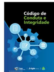
Time GEGRC realizou treinamento sobre Código de Conduta e Integridade durante o mês de Julho.

O treinamento sobre o Código de Conduta e Integridade atende ao disposto no Decreto Federal nº 11.129/2022 que regulamenta a aplicação da Lei Anticorrupção 12.846/13.