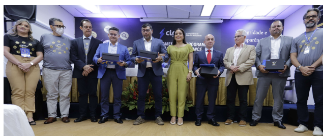
O lançamento do Programa Cigás em Compliance contou com a presença de autoridades do Estado e Município.