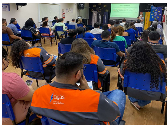
Colaboradores de diversos setores prestigiaram o evento.

No dia 09/08 recebemos a Dra. Lúcia Magalhães - Subcontroladora Geral de Controle Interno da Controladoria Geral do Estado – CGE, que apresentou a palestra: “A importância do Controle Interno na Companhia de Gás do Amazonas - Cigás”.