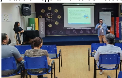
Time COGEP realizou o treinamento sobre Regulamento de Pessoal