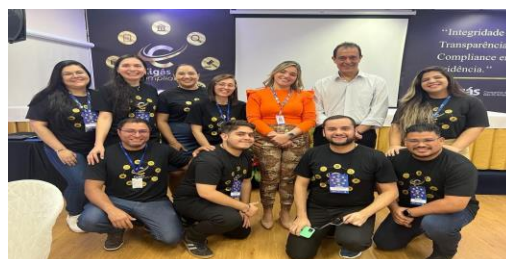
Time da Gerência de Governança, Riscos e Compliance – GEGRC e Diretor-Presidente.

O Programa, que foi o primeiro do gênero na administração pública Estadual, foi inicialmente constituído por sete Pilares, compostos por ações e iniciativas que visam fortalecer a transparência corporativa e combater atos de desvios, fraudes ou irregularidades, de forma a preservar a conduta empresarial íntegra.