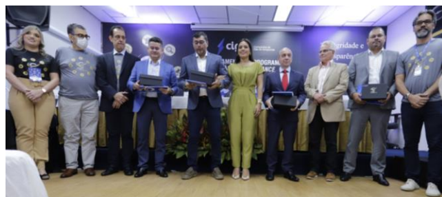
O lançamento do Programa Cigás em Compliance contou com a presença de autoridades do Estado e Município.

É essencial para a gestão do Compliance que todos os colaboradores demonstrem por meio de exemplo pessoal, aos nossos clientes, fornecedores e parceiros o comprometimento com as normas de conduta e valores éticos preconizados pelo Programa Cigás em Compliance. A integridade tem de estar no centro das ações de cada um de nós.