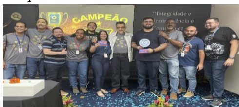
O time da GETIN foi o grande Campeão da Copa Cigás em Compliance.

Em disputa emocionante contra a Gerência Jurídica – GEJUR, a Gerência de Tecnologia da Informação - GETIN venceu a primeira edição da Copa Cigás em Compliance!