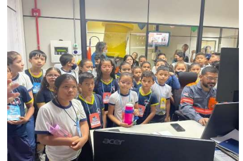
Alunos visitaram o CCO.

Além de conhecerem as instalações da Companhia, as crianças também participaram da “Trilha da Integridade”, uma gincana composta por várias atividades (coleta seletiva, quebra-cabeça, jogo da velha, soletrando, quizz do conhecimento e concurso de desenho) que tinham como objetivo reforçar os conceitos apresentados no dia anterior e ensinar por meios lúdicos valores importantes para a formação de bons cidadãos.