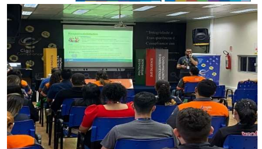
Time GEGRC realizou treinamento sobre as Políticas Anticorrupção e de Recebimento de Brindes em Setembro.