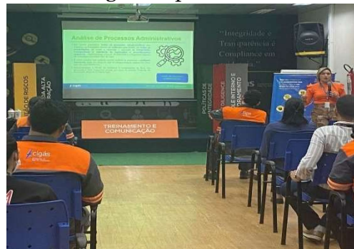
Time GEGRC realizou treinamento sobre as Políticas de Gestão de Riscos e Controles Internos em Setembro.

Nos dias 13/09 e 15/09 foram realizados pelo time da GEGRC treinamentos sobre a Política Anticorrupção e de Prevenção à Lavagem de Dinheiro e a Política de Recebimento de Brindes, Presentes, Hospitalidades ou Benefícios Similares, cujo objetivo é disseminar a cultura de conformidade no ambiente corporativo e fortalecer os pilares do Programa Cigás em Compliance . Os treinamentos realizados em 04 turmas, fazem parte da formação básica obrigatória para todos os colaboradores da Companhia.