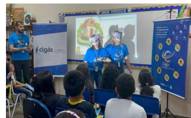
Apresentações teatrais de fábulas fizeram parte do evento.