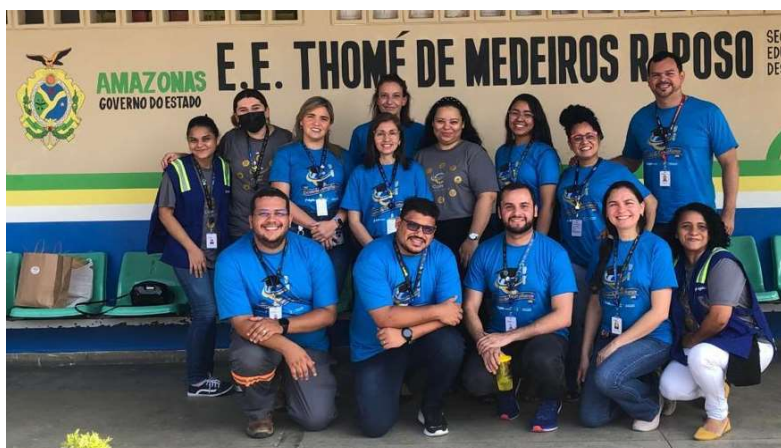
No dia 13.10 o time da Cigás visitou a Escola Estadual Thomé Raposo, onde foram desenvolvidas atividade como o cultivo de plantas, teatro e palestras.

As atividades foram desenvolvidas ao longo de dois dias (13.10 e 14.10) com 40 alunos do 4º e 5º anos do Ensino Fundamental I da Escola Estadual Thomé de Medeiros Raposo, e tiveram como objetivo desenvolver de forma lúdica temas como: Educação Moral e Ética, Sustentabilidade, Respeito à Diversidade e Gás Natural como fonte de energia sustentável.