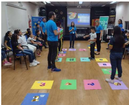
Trilha da Integridade.

No dia 14/10, foi a vez das crianças visitarem a sede da Companhia de Gás do Amazonas - Cigás, onde foram recepcionadas pelo nosso mascote, o “Dutinho”, e conheceram o Centro de Controle de Operação - CCO, que é responsável por fazer o monitoramento da nossa Rede de Distribuição de Gás Natural 24h por dia, 7 dias por semana.